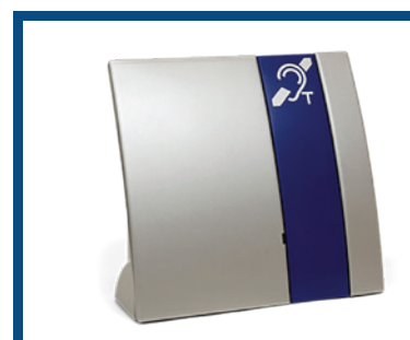
Sistema Portátil de Bucle Auditivo

Ideal para personas con pérdida auditiva leve a moderada que no utilizan audífonos. Este amplificador de mano ayuda a clarificar el sonido y reducir el ruido de fondo. Es útil en situaciones individuales o en grupo.