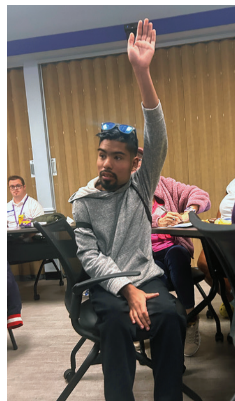
Un participante curioso durante la capacitación

TransCen: A medida que una persona crece, adquiere más independencia y más responsabilidades. De estas experiencias de crecimiento, conseguir empleo es una de las más importantes. Venga y escuche a oradores y capacitadores para aprender más sobre las oportunidades de empleo disponibles para usted en nuestra comunidad.