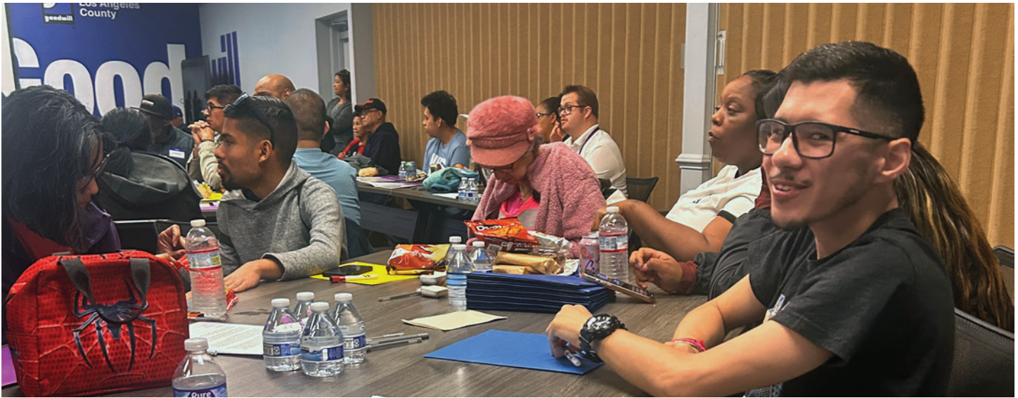
Personas interesadas de Harbor aprenden sobre sus derechos en una capacitación HCBS