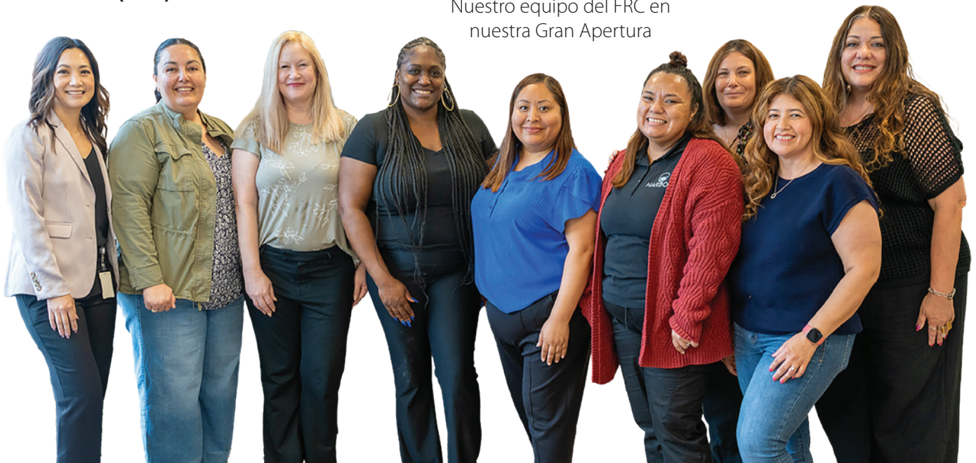
Nuestro equipo del FRC en nuestra Gran Apertura

Le animamos a tomarse un momento para actualizar sus registros con nuestra nueva dirección y número de teléfono. Esperamos darle la bienvenida a nuestro nuevo espacio, mientras seguimos comprometidos en servir y apoyar a las personas con discapacidades del desarrollo y a sus familias.