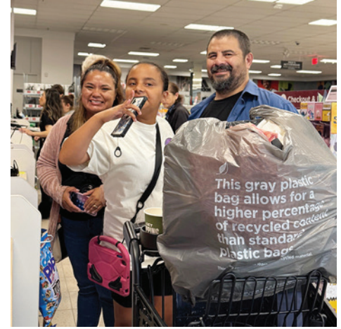
Los estudiantes, sus familias, Rotary Sunrise y el personal de Harbor están todos sonrientes en Kohl's.

suéteres nuevos. La alegría iluminaba cada rostro, mientras las familias se despedían con bolsas llenas de nuevos atuendos, listas para afrontar el próximo año con entusiasmo.